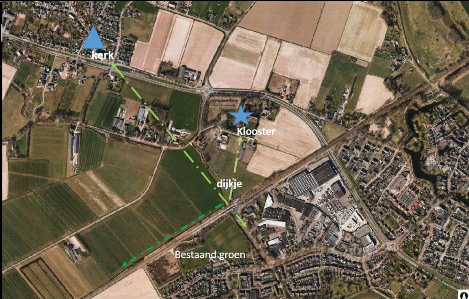
Bijzondere historische elementen in de omgeving -> verankering in de omgeving