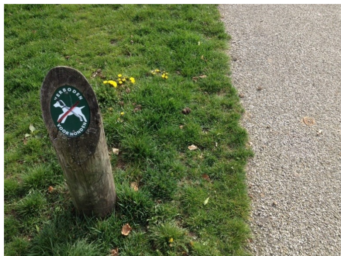
Verboden voor honden "met poep"