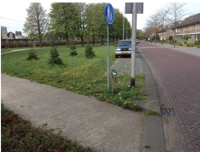
Hondenlosloopterrein niet omheind