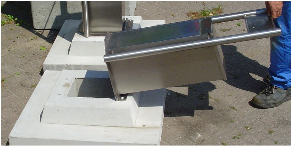
Hondentoilet met ondergrondse opvangput