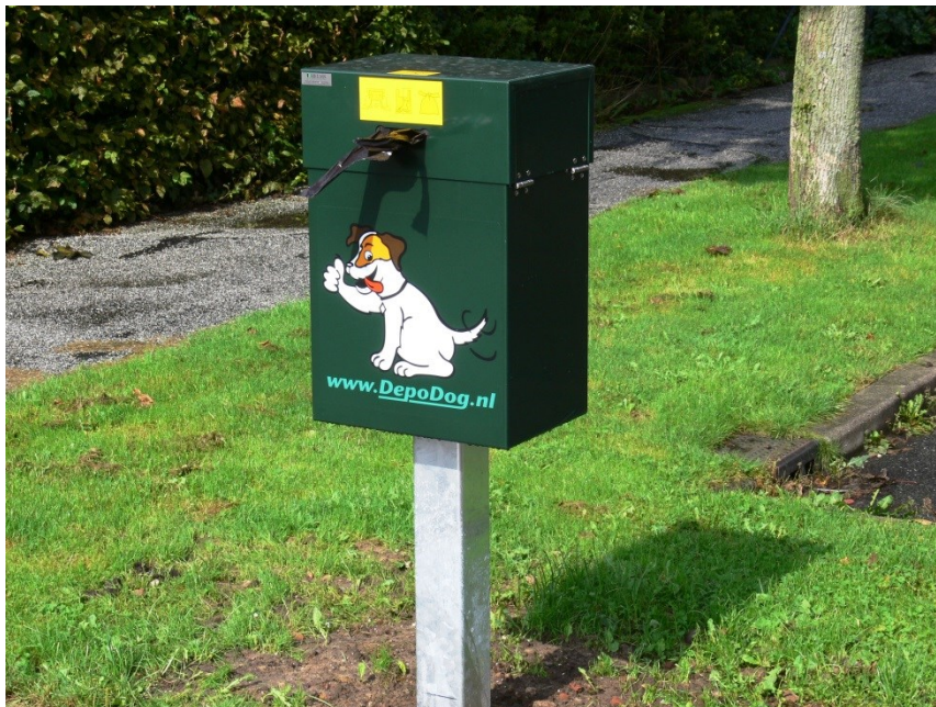
Afvalbak voor hondenpoep "Depodog".