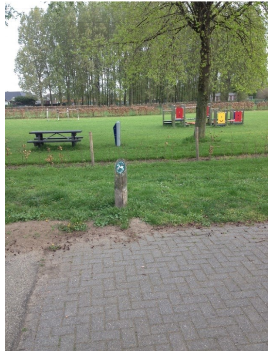
Speelterrein verboden voor honden