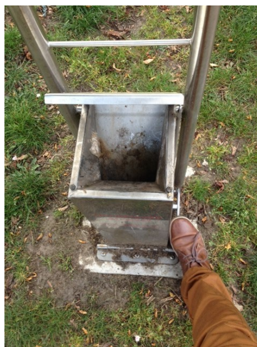
Hondentoilet Gepp met voet te bedienen