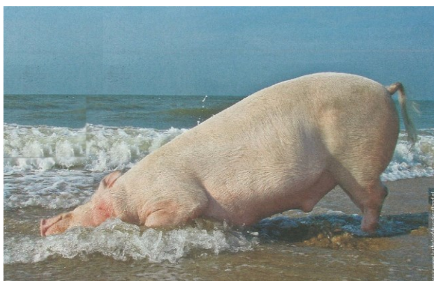
Varken aan zee

Zoals aangegeven is de invloed van de gemeente op het welzijn van dieren in de intensieve