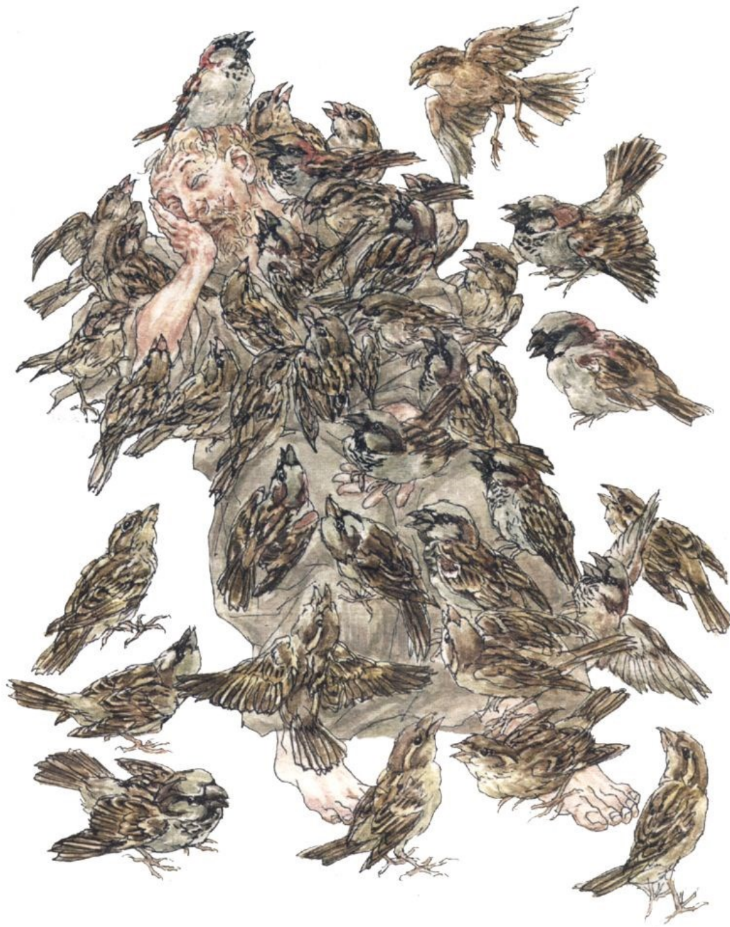
Illustratie Peter Vos

Afdeling Stadsbeleid/Ruimtelijke Ontwikkeling